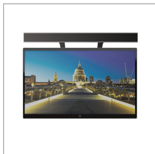
La barre de son peut être montée au-dessus ou au-dessous de l'écran