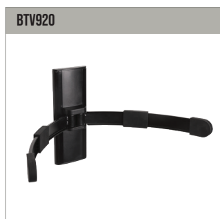
Étagère réglable pour des éléments audiovisuels jusqu'à 10 kg