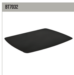
Étagère large pour des éléments AV, dimensions 500mm x 380mm