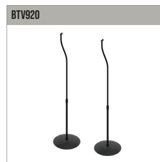
Supports sur pieds de Home Cinema pour les haut-parleurs jusqu'à 2 kg