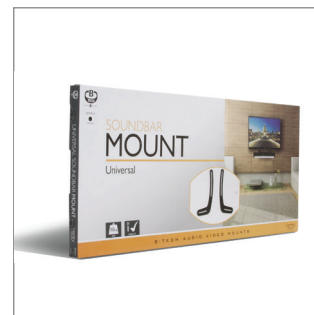
Livré dans un emballage de vente au détail,