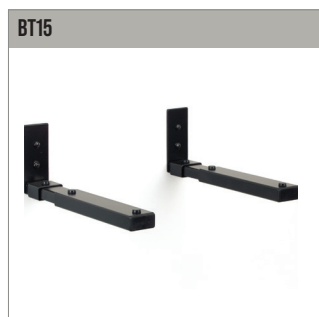
Support mural pour haut-parleurs avec bras réglables, pour les haut-parleurs jusqu'à 15 kg