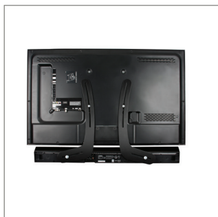
Peut être facilement monté au dos de l'écran