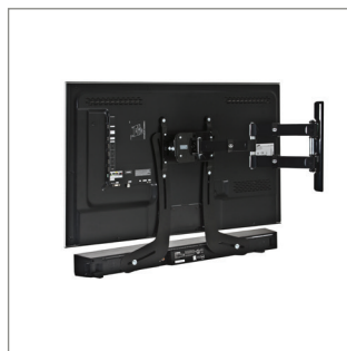
Convient aux installations d'angle avec un support pivotable